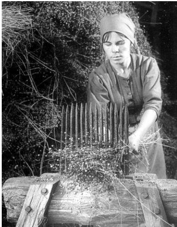
Hekel: instrument om vlas van zaaddozen te ontdoen.