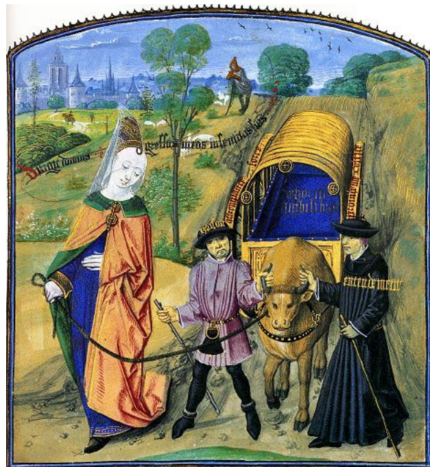
645-E1 & 646-E Reizen rond 600 Een riskante activiteit!