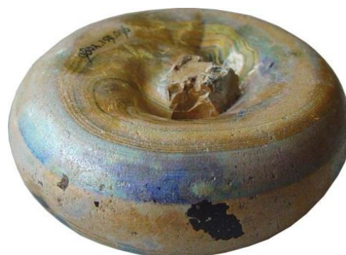
663-N Doopton Rond 600 worden tonnen voor van alles en nog wat gebruikt. Zelfs voor religieuze doeleinden. Waarom worden bekeerlingen driemaal onder water geduwd?