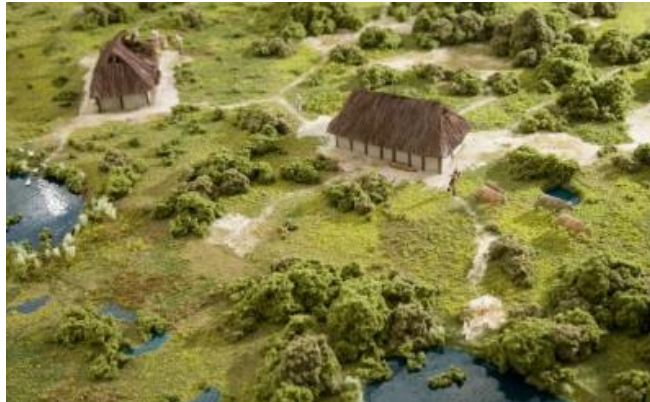
Dorp in het Noord-Hollandse duingebied

Ten zuiden van de grote rivieren wonen de Franken. Hun koning heet Clovis. Hij verovert het ene gebied na het andere. Om politieke redenen vindt hij het slim zich te laten dopen. Wat betekent dat voor zijn onderdanen? En hoe probeert Clovis zich bij de inwoners van Tours (stad in het huidige Frankrijk) populair te maken?