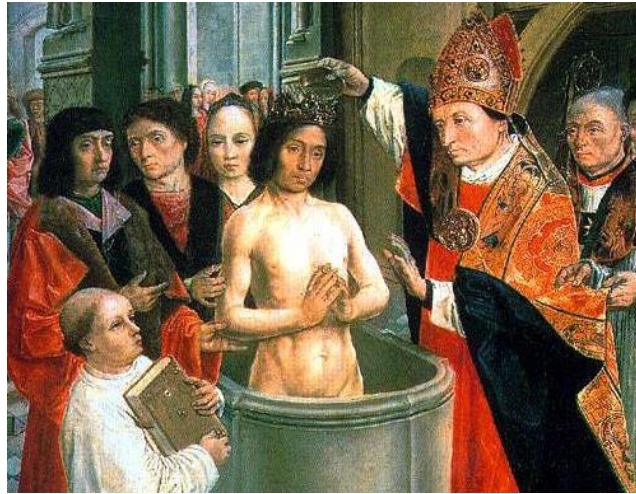
Doop van Clovis, koning van de Franken

De Friezen hebben een probleem. Ze wonen weliswaar hoog en droog op zelf opgeworpen terpen, maar het omliggende land is niet geschikt voor het verbouwen van graan. Waarom zal duidelijk zijn, maar welke oplossing hebben de Friezen?