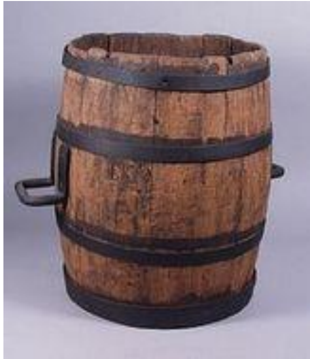
644-E1 Verpakkingsmateriaal De amfora is helemaal uit...