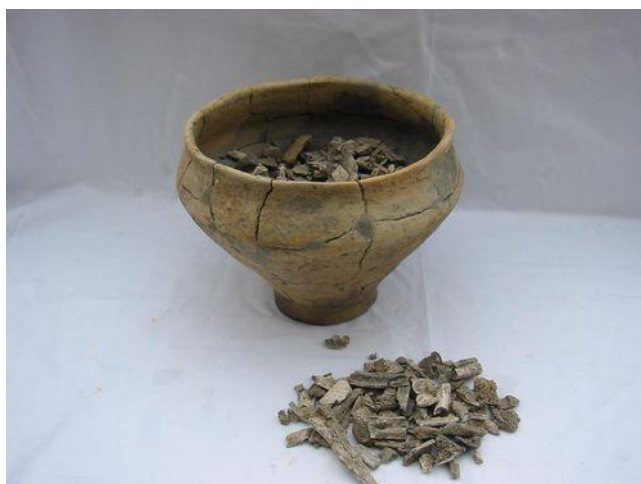
Urn met menselijke overblijfselen van rond 600

Waardoor weten we zo weinig weten over wat er in deze tijd in de Lage Landen gebeurde?