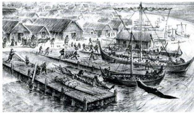
Haven van Dorestad