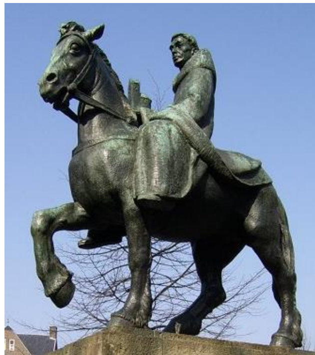
658-N1 Bekend Het geboortjaar van deze man. Zijn wieg staat in Engeland, zijn standbeeld in Utrecht. Rara hoe zit dat?