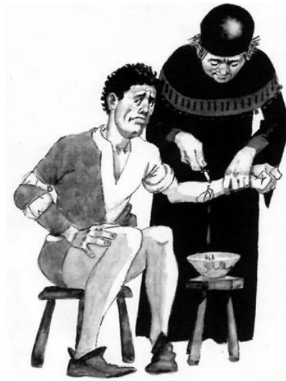
647-E1 Komt een man bij de dokter... De gezondheidszorg staat nog in de kinderschoenen!